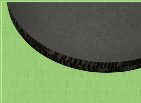
Sort gennemfarvet papfod

Fold-Up Runddel består af 3 alm. Fold-Up 80x200 du blot sætter sammen på én speciel fod – perfekt til en messestand.