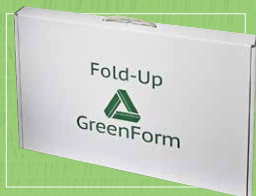
Alle Fold-Up bliver leveret i praktisk transport æske